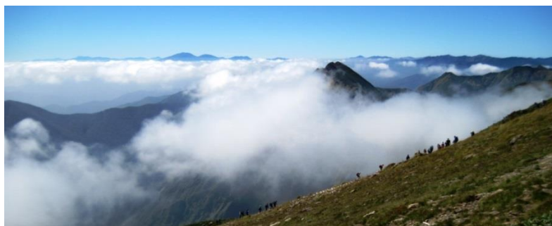
<秋晴れの谷川岳天神尾根>