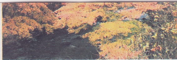
10月下旬ごろから始まる北茨城市の花園溪谷の紅葉

一口駐車場▽約30店舗の出店者が地元の食材を使った新商品を提供販売し、来場者の投票でグランプリを決定▽市商工会会 0295(53)3100 ●常陸大宮ゴルフスタンプラリー(常陸大宮市) 10月1日12月31日▽市観光協会加盟ゴルフ場▽3カ月間で2回以上、3回プレーを行いスタンプ三つ集めると市内宿泊施設の割引券、ゴルフ場の無料プレー券、特産品などを景品の抽選に応募できる▽市観光協会 0295(52)1111 ●第21回奥久慈大子まつり(大子町) 10月21日午前9時〜午後3時30分▽町文化福祉会館まいん▽キャラクタージュョーやステーション、参加型イベント、特産品の展示販売▽町企画観光課 0295(72)1138