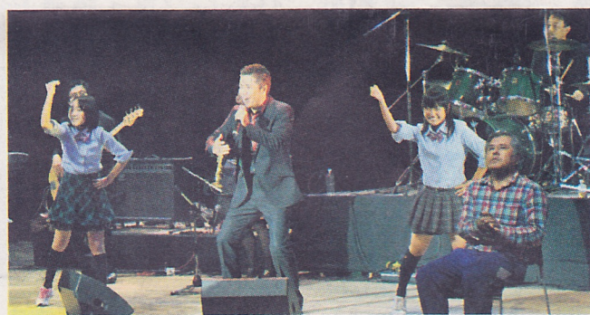
最優秀賞に輝いた「YES BAND」 =小美玉市・小川文化センターアピオス

音楽を愛する大人がステージ上で輝く「おやじバンドコンテスト」が23日、小美玉市小川の小川文化センターアピオスで開かれ、水戸市を中心に活動する「YES BAND」が最優秀賞に輝いた。コンテストは、メンバーの平均年齢30歳以下を条件に、東京や山梨の県外のグループも含めて7組が出場した。ロックやポップス、フォークなどの音楽を披露し、演奏力や歌唱力、パフォーマンスなどを競った。今年で3回目。 最優秀賞に輝いた「YES BAND」