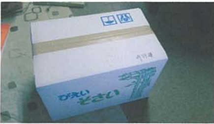
大きい箱届きました

抽選方法は 私と交信してログを提出した局をピックアップし番号を付けビンゴマスターで抽選しました。