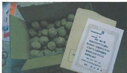
中に賞状が入っていました