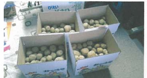
5キロ箱4個に小分けしました