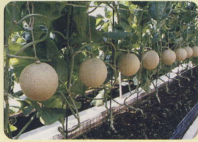
マスクメロンのブランド「クラウンメロン」。温室メロンでは全国一の質、量を誇ります。

江戸から数えても、京都から数えても27番目。袋井市は北海道五十三次のどまん中の宿場町として古くから栄えてまいりました。地域は太平洋を臨む海岸線から山間部まで、緑豊かな地域で、静岡県下随一の穀倉地帯では、米やお茶の生産が盛んに行われ、とくに温室メロン「クラウンメロン」は全国一の生産を誇っています。観光面では、全国でも屈指の「可睡ゆり園」や遠州三山など古刹を中心年間約500万人の観光客が訪れます。さらに「ふくろい遠州の花火」では3万発の花火が夏の夜空を彩ります。