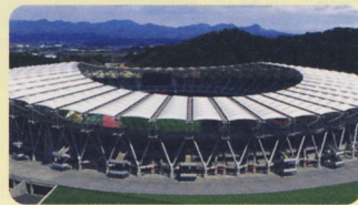
毎年多くのイベントが開催される、静岡県の施設「エコパスタジアム」。

「りんピック」をそれぞれ開催しました。箱物行政が批判されている中、袋井市では国体選手2000人以上を民泊でももてなしをするなど、施設を活用したソフト事業も積極的に展開しています。