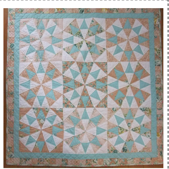
2018 Year's Quilt Akiko.K